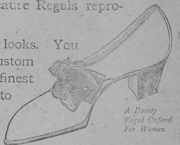
A Dainty Regal Oxford For Women